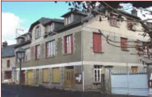
Foyer Rural Le Falgoux Programme en cours de définition

des fleurs selon les milieux, la faune sauvage, la pâture conséquence sur nos paysages