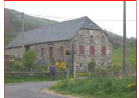
Ferme-étable Dienne / SMPM Esquisses en cours

les pierres : du labours de l'homme ériger pour : se guider, s'abriter, se substenier