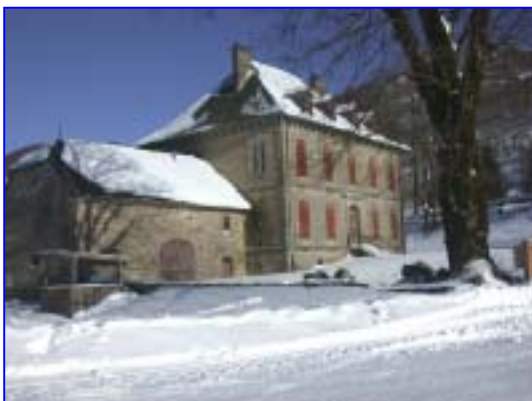
Enclos Cheylus Mandailles St Julien Esquisses réalisées